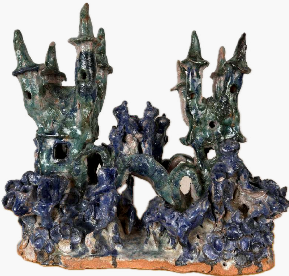
Stefan Holz Müller, sans titre, 32x35x20 cm, 1986