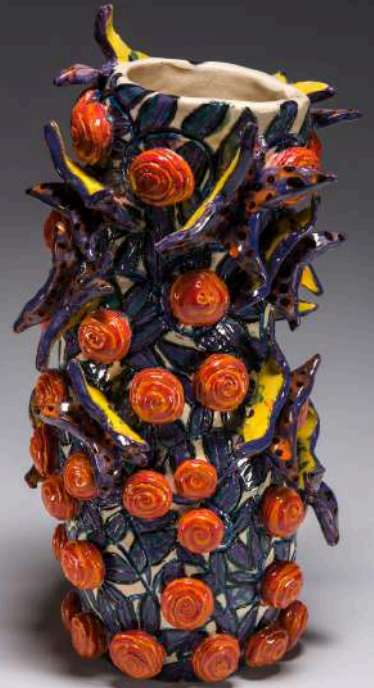
Morgane Salmon, vase aux papillons, 32x28cm, 2019