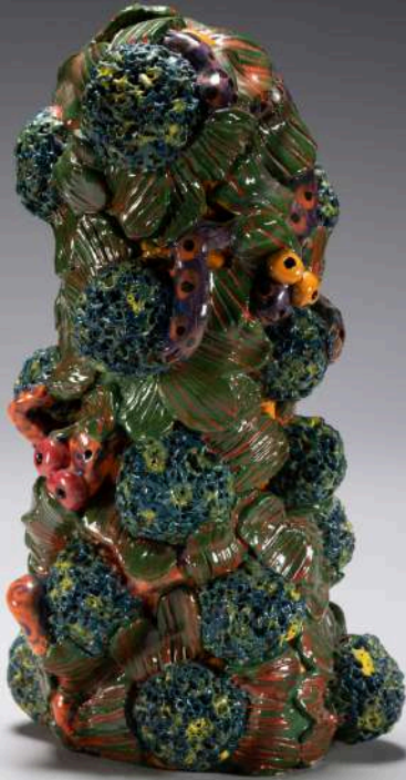
Morgane Salmon, Rainforest, 33x20cm, 2017