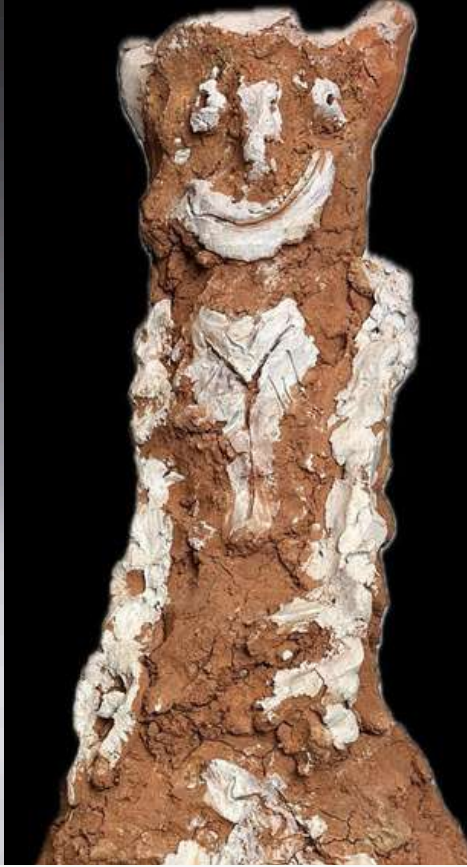
Stefan Holz Müller, sans titre, 65x23x18 cm, non datée