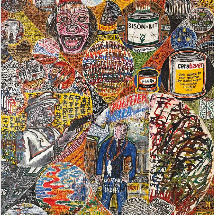
Collage 2000, Beljon inc., 1971 Details